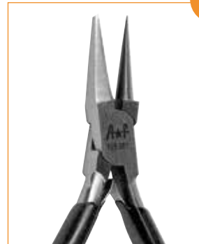
Détail de la pince 20199 Detalhe alicate 20199