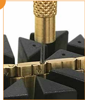
Insérer le maillon (détail) Introduzir passador (detalhe)