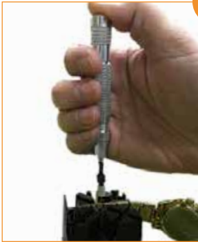
Enlever le maillon Retirar passador