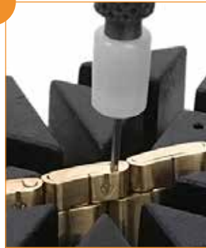
Enlever le maillon (détail) Retirar passador (detalhe)