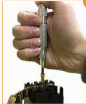
Insérer le maillon Introduzir passador